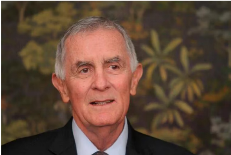
Carlos Gustavo Cano renunció a la Junta Directiva de Ecopetrol en la tarde del jueves 16 de febrero del 2023.

Luego de conocerse su renuncia a la Junta Directiva de Ecopetrol , el exministro de Agricultura Carlos Gustavo Cano publicó una carta en la que habló, entre otras cosas, de la actual situación económica de Colombia y de la independencia de algunos órganos.