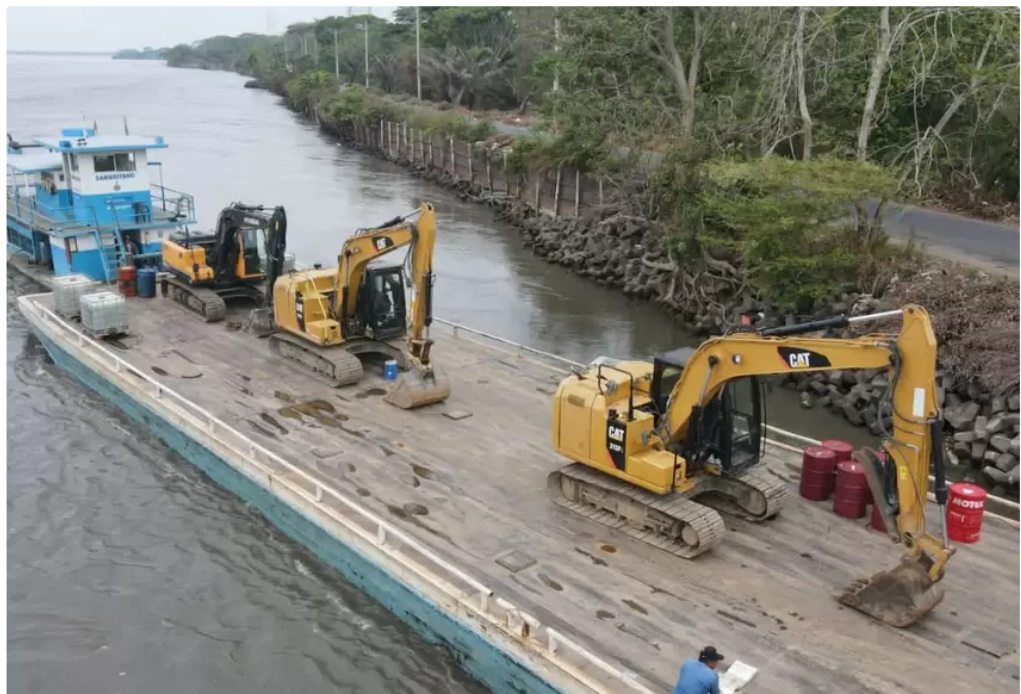
Dragado río Magdalena en Puerto Wilches