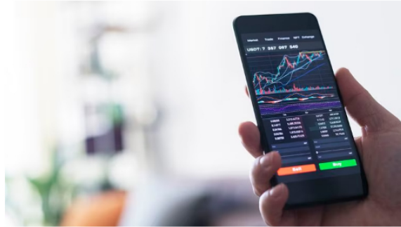
Estas aplicaciones se han pensado para ayudar a que más personas diversifiquen sus ingresos, y ayudando a su vez a que el mercado bursátil no sea un terreno de pocos, sino que es brinda oportunidades a muchos, desde pequeñas cantidades de dinero.

Los requisitos que se solicitan para abrir una cuenta en Tril son: cédula de identidad, datos demográficos básicos y tener un celular y correo electrónico, a los cuales van a llegar los códigos de verificación. Una vez que se instale la aplicación, se deben seguir las instrucciones que la app indica y comienza a invertir en acciones. Se puede escoger desde Ecopetrol, Cementos Argos, Grupo de Energía de Bogotá, Amazon, Apple, Pfizer, Bank of America Corporation, entre otras.