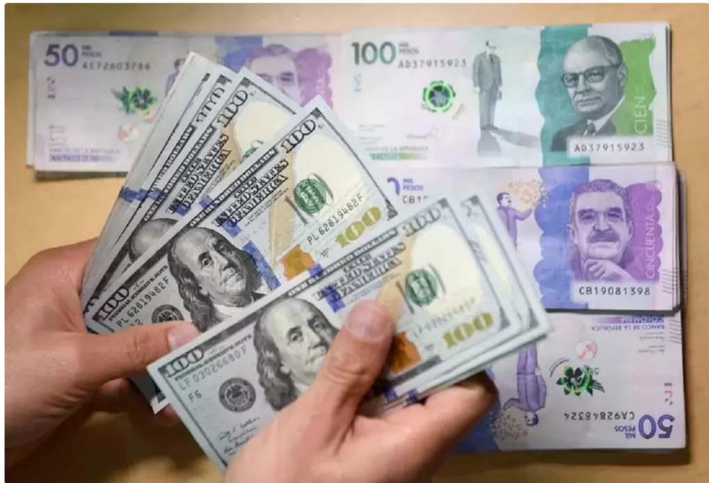
Dólares y pesos