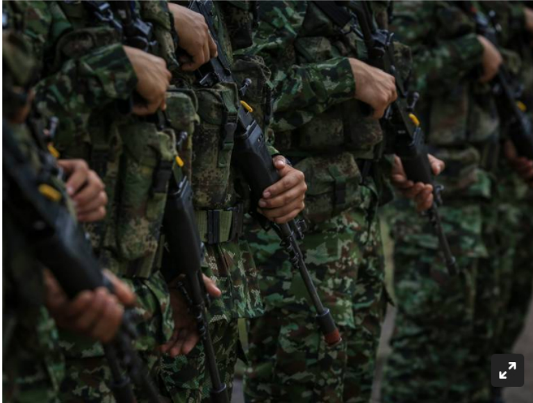
Imagen de referencia del Ejército Nacional.

El ELN sería el responsable del atentado contra la infraestructura del oleoducto Caño Limón Coveñas en Arauca.