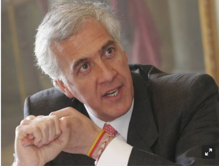
Samuel Moreno Rojas

Mediante un comunicado de prensa el Hospital Militar central, conformó la muerte del político condenado por el carrusel de la contratación en la capital.