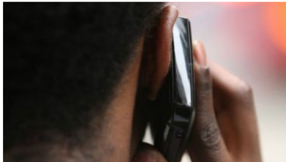
El sujeto intimidaba a sus víctimas.

“Realizaba exigencias económicas que oscilaban entre los 100 millones y mil millones de pesos a cambio de no atentarse contra su integridad y/o de las infraestructuras de sus empresas”, mencionaron las autoridades en un comunicado.