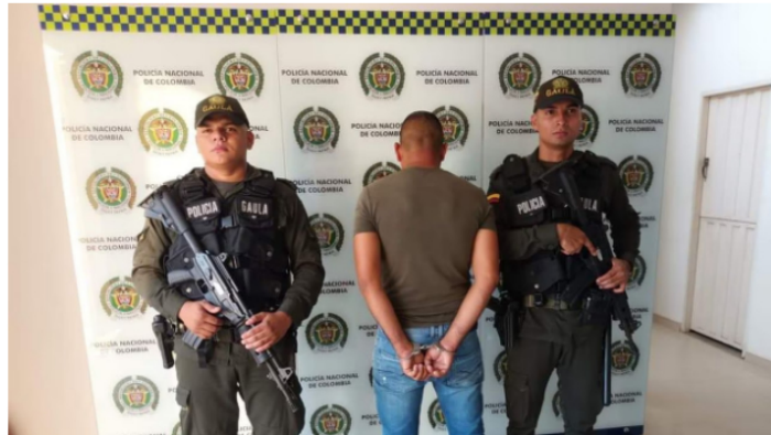
Este sujeto se identificaba con sus víctimas como cabecilla financiero del frente Caupiza en Barrancabermeja del ELN.

En las últimas horas, las autoridades del departamento de Santander, realizaron una contundente operación, donde se logró la captura de quien sería un presunto terrorista que haría parte del grupo criminal ELN.