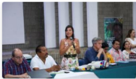
La Guajira tendrá el presupuesto más alto en 12 años por regalías: minminas