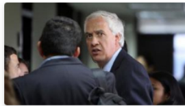
Fallece el exalcalde de Bogotá Samuel Moreno