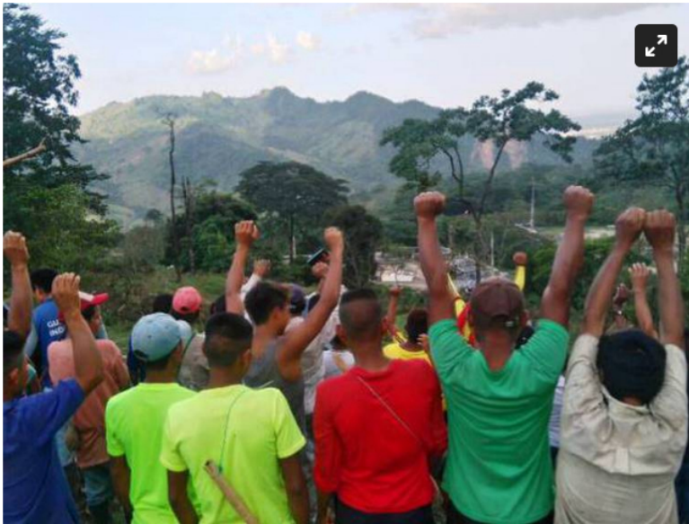
Gobierno y Uwa se sentarán a dialogar

Luego de horas de discusión la población indígena U'wa considera que es vital el agua y sus recursos naturales, antes que la exploración de petróleo.