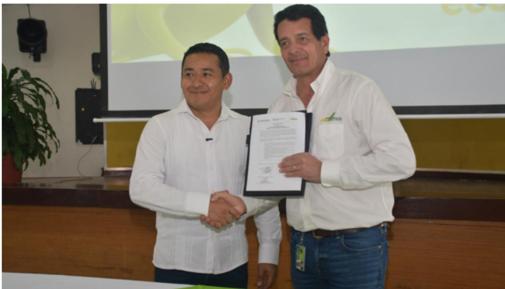
Arturo Luna (Ministro de ciencia) y Felipe Bayón (Presidente Ecopetrol).

Este acuerdo con Ecopetrol beneficiará los ecosistemas y la economía gracias a la transición energética