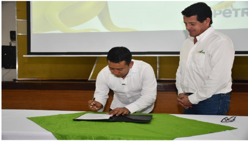
Arturo Luna (Ministro de ciencia) y Felipe Bayón (Presidente Ecopetrol ).

“Esta es una iniciativa que nos va a permitir a través de compromisos específicos, avanzar hacia una transición energética justa en Colombia. El desarrollo de oportunidades en investigación y capacitación es indispensable para fomentar los cambios en esta materia, por eso, estoy segura que este es el principio de una gran articulación para la transición energética en nuestro país”, explico Irene Vélez, Ministra de Minas y Energía.