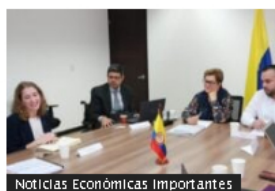
Noticias Económicas Importantes

Estas son las recomendaciones que hace la OIT a la reforma pensional y laboral de Colombia