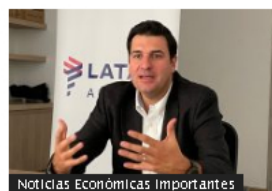
Noticias Económicas Importantes

Ultra lanza nueva promoción en Colombia: vuelos desde $12.000, conozca en qué rutas