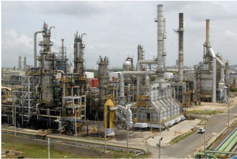
Foto de archivo. Vista general de la refinería de Ecopetrol en Cartagena, Colombia, 24 de agosto, 2006.

Ecopetrol , la empresa de hidrocarburos nacional, advirtió sobre fraudes a su nombre , en Internet, después de que, en los últimos días estuvieran circulando ofertas de empleo, supuestamente, con la petrolera.