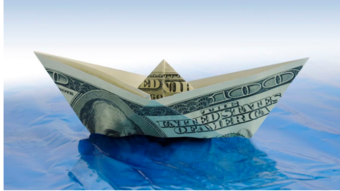
Esta ha sido una semana de acaz y bajas para el dólar en Colombia.

El precio del dólar en Colombia se mantiene a la baja y este miércoles 8 de febrero amaneció con fuertes caídas en su cotización. Esto, debido a los mensajes de tranquilidad que surgieron desde la FED (Reserva Federal) o banco central estadounidense con respecto al futuro de las tasas de interés y los ajustes de su política monetaria para garantizar que sigan bajando los precios y desacelerar la generación de empleo, sin llevar la economía a una crisis.