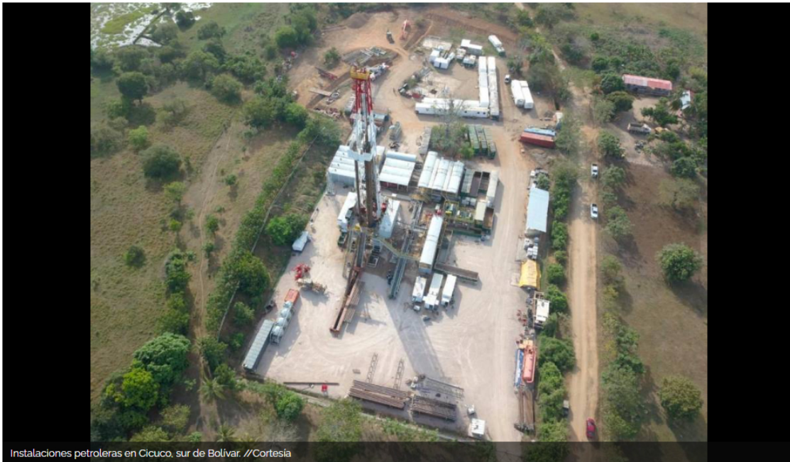
Instalaciones petroleras en Cicuco, sur de Bolívar.

Un estudio de la Asociación Colombiana del Petróleo y Gas revela más causas de la caída de la inversión privada en exploración de hidrocarburos.