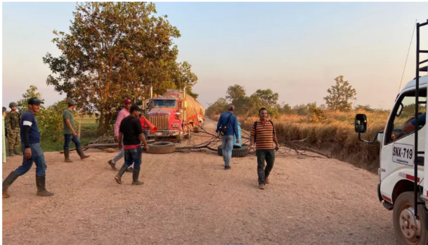
Bloqueos. Ecopetrol .

Campesinos y habitantes de Puerto Gaitán exigen la pavimentación de la vía a Campo Rubiales.