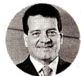
Felipe Bayón Presidente de Ecopetrol

Siganos en: www.larepublica.co Para conocer el resto de bloqueos que se presentan en el país.