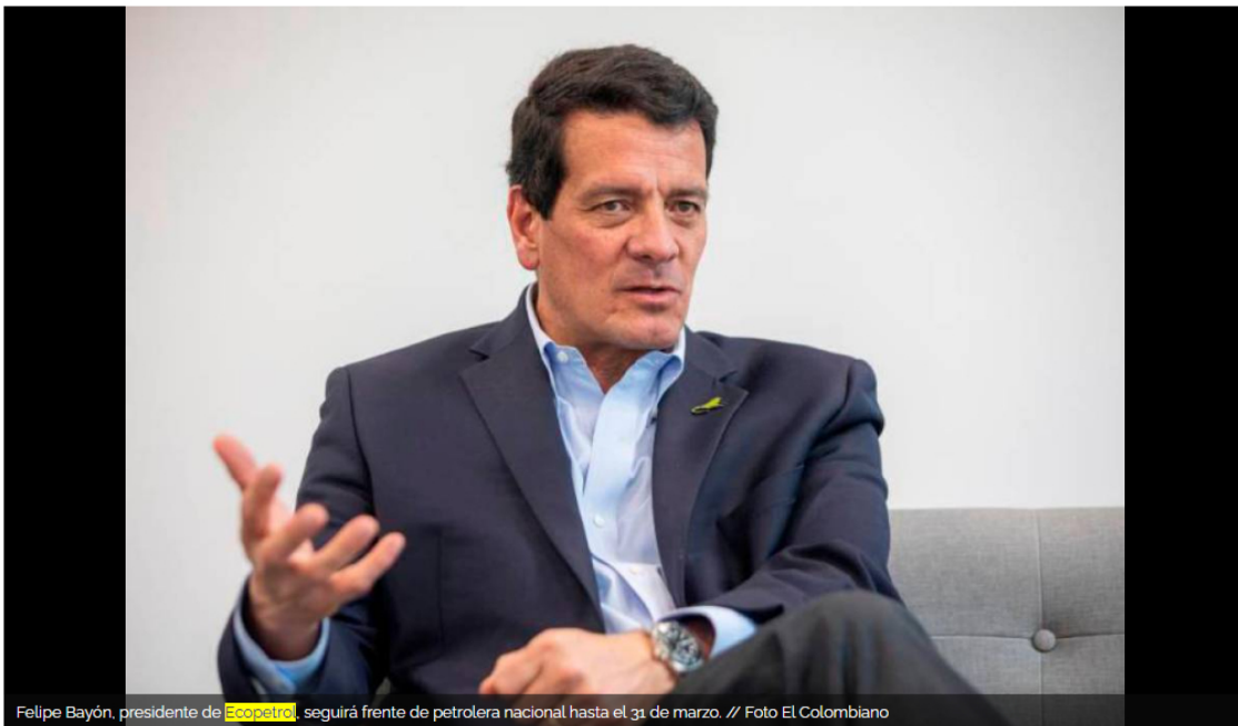
Felipe Bayón, presidente de Ecopetrol , seguirá frente de petrolera nacional hasta el 31 de marzo.

Mientras en Estados Unidos la petrolera nacional desarrolla la técnica con rentabilidad, ganancias económicas y aumento de reservas.