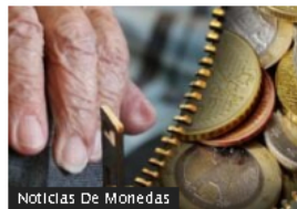
Noticias De Monedas

Cabify lanza descuento para pedir taxi en día sin carro en Bogotá