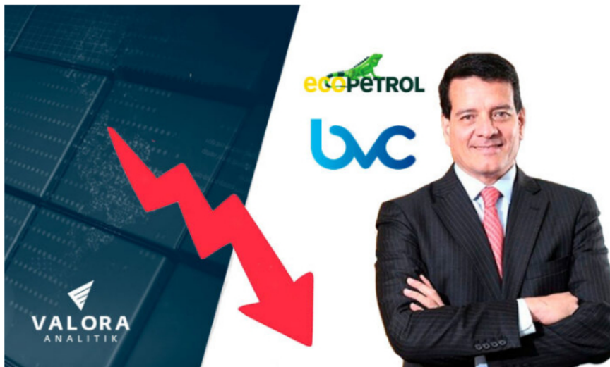
Felipe Bayón, presidente de Ecopetrol y acciones bvc

La noticia sobre la salida de la empresa de Felipe Bayón, presidente de Ecopetrol , sigue causando revuelo en el país y ahora su efecto negativo se ha trasladado al mercado accionario colombiano .