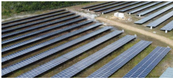
En departamentos como el Guainía, la energía solar será una alternativa clave como fuente de suministro.