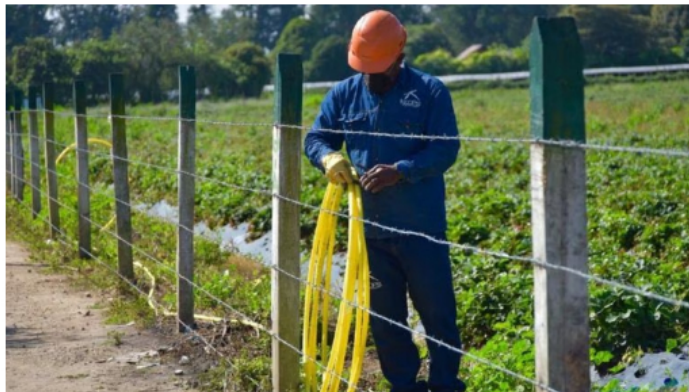
En el campo y en zonas urbanas, aún hay 1,5 millones de familias que cocinan con leña.

No obstante, Bayón puso sobre el tapete otra realidad. Hay un millón de motos nuevas, a gasolina, pese a que poco a poco van llegando también vehículos eléctricos. La invitación entonces es a que todos los ciudadanos sean concientes que, descarbonizar requiere la participación de cada uno, pues cada año ponemos 5 toneladas de CO2 con las actividades cotidianas, por lo cual, enfatizó en que el problema no son las fuentes energéticas alternativas, que las hay, sino cómo detenemos las emisiones. El que sabe sabe.