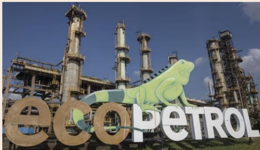
Señalización en la refinería de Ecopetrol Barrancabermeja en Barrancabermeja, Colombia.