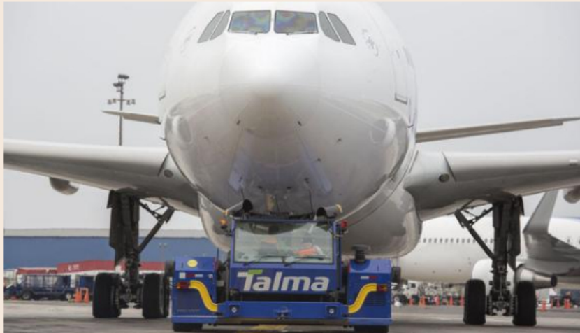
Talma se expande en Colombia al adquirir Servicios Aeroportuarios Integrados de Avianca.

Con esta adquisición, la empresa peruana prestará servicio de rampa a más de 1,000 vuelos al día en su red.