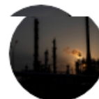
Programa La WRadio