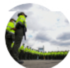
Sigue La W