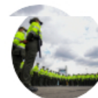
Sigue La W