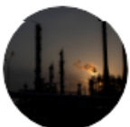
Programa La WRadio