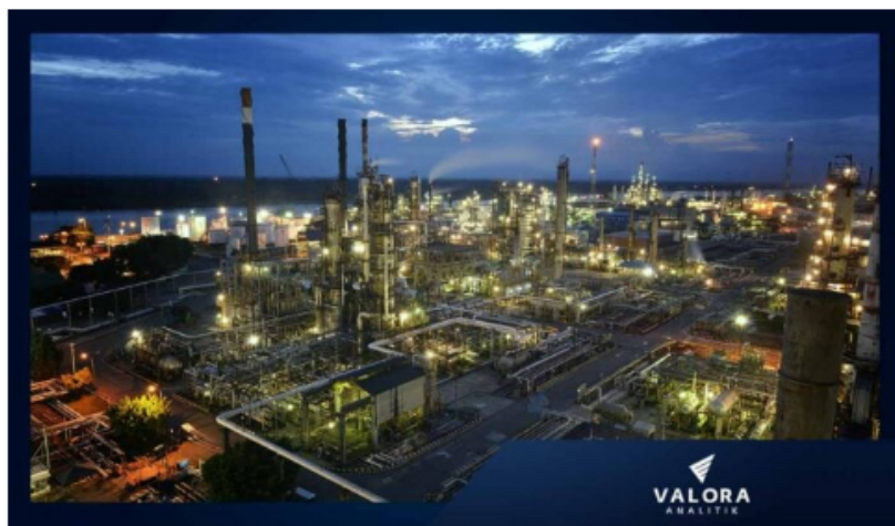
Refinería de Barrancabermeja de Ecopetrol .

Por Yennyfer Sandoval - Periodista Minería y Energía - 2023-01-30