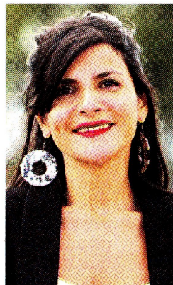
Irene Vélez Torres, ministra de Minas y Energía.