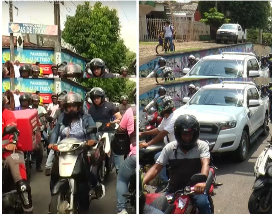
Bloqueos en Barrancabermeja