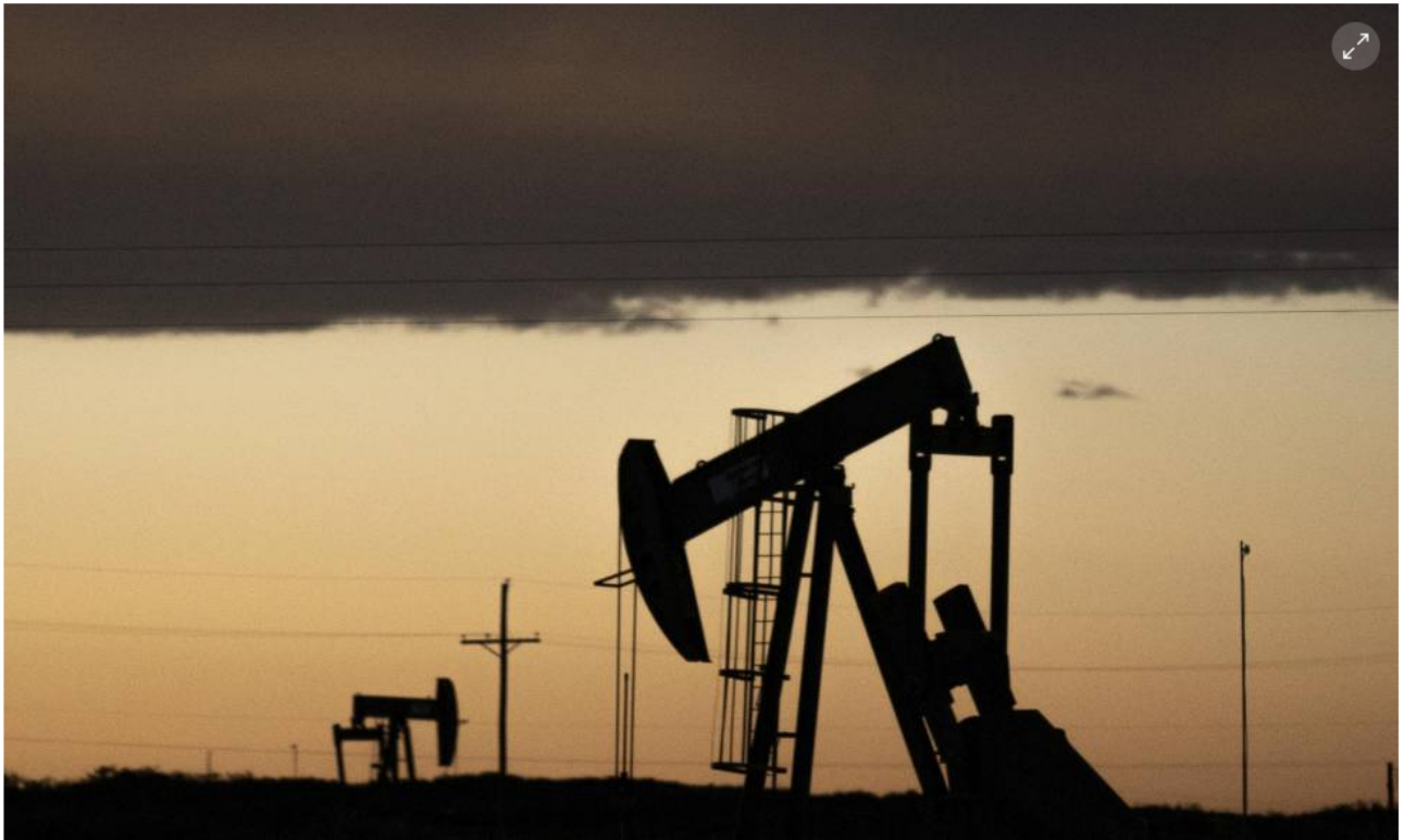
Reservas de petróleo, imagen de referencia.