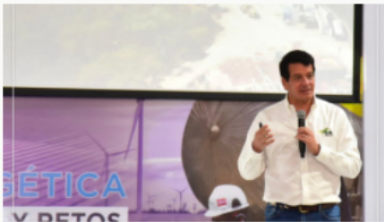
Felipe Bayón deja la presidencia de Ecopetrol