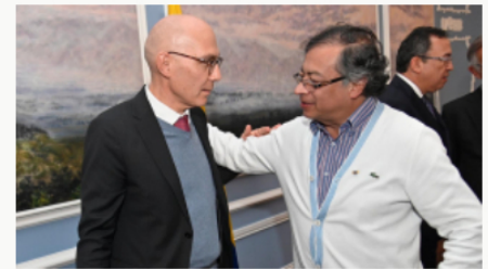
Alto Comisionado de Naciones Unidas expresa su apoyo a la Paz Total