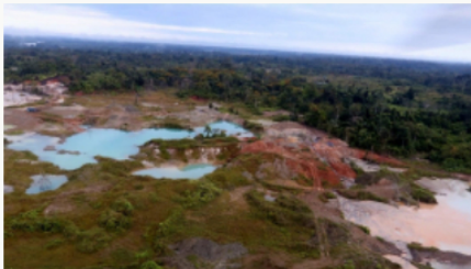
Golpe a la minería ilegal en el Pacífico nariñense