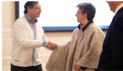
Presidente Petro vuelve a referirse a la construcción del Metro de Bogotá