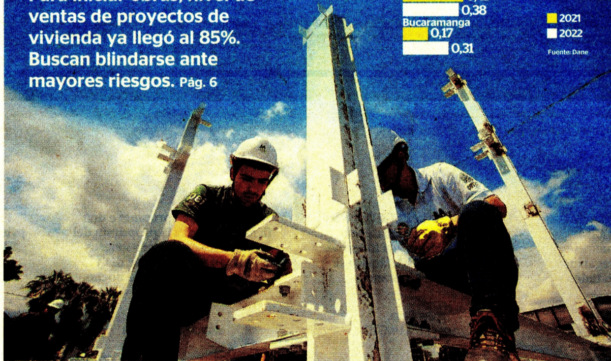
Ante una variable clave como los desistimientos, las firmas buscan no afectar su rentabilidad.

Para iniciar obras, nivel de ventas de proyectos de vivienda ya llegó al 85%. Buscan blindarse ante mayores riesgos. Pág. 6