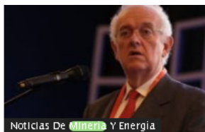
Noticias De Minería Y Energía

Ministra Irene Vélez dice desconocer de dónde tomó Petro datos de reservas de gas