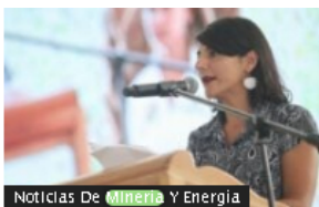
Noticias De Minería Y Energía

Fabricato apunta a que exportaciones representen 40 % de sus ventas en el corto plazo