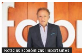
Noticias Económicas importantes

Fabricato apunta a que exportaciones representen 40 % de sus ventas en el corto plazo