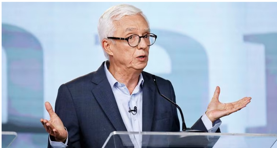
Jorge Enrique Robledo, exprecandidato presidencial y excongresista, quien estuvo durante varios años en la Comisión Quinta del Senado, en la que se debate temas de hidrocarburos.

...mismo que el jefe de la carrera de Minas y Energía “debe renunciar inmediatamente a su cargo” ya que, según él, “sobre petróleo y gas dio cifras que no son ciertas y porque en el informe falsificaron las firmas de la viceministra de Minas y de otro alto funcionario, que no lo firmaron”.