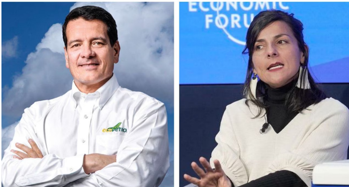
El presidente de Ecopetrol, Felipe Bayón, y la ministra de Minas y Energía, Irene Vélez.

El excandidato presidencial y excongresista John Milton Rodríguez se sumó este miércoles a la controversia por la permanencia de la ministra de Minas y Energía, Irene Vélez, en su cargo y propuso al actual presidente de Ecopetrol , Felipe Bayón, para reemplazarla.