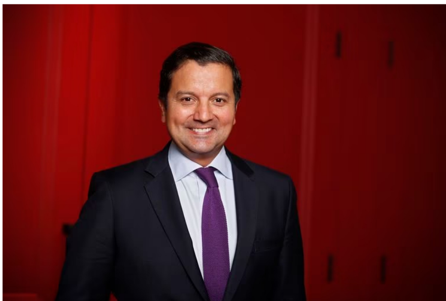
El senador por Cambio Radical David Luna.

“Es el colmo que Petro se atreva a decir que reemplazará los hidrocarburos por más turistas extranjeros, porque es imposible aumentarlos hasta que sus gastos iguallen los ingresos en dólares por petróleo. Y porque constituye otro engaño igualar la plata que les entra a unos particulares con la que le llega al Estado a través de Ecopetrol ”, dijo Robledo refiriéndose a la explicación del jefe de Estado de sustituir los ingresos por la explotación de hidrocarburos con el turismo.