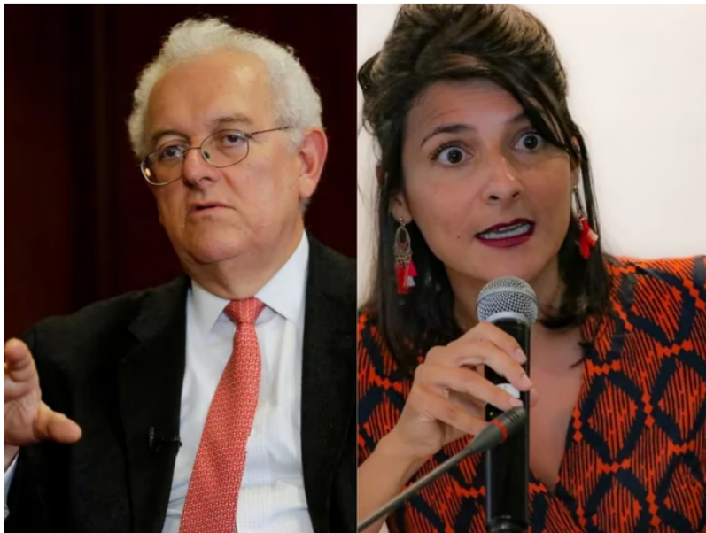
José Antonio Ocampo, ministro de Hacienda, e Irene Vélez, ministra de Minas y Energía.

El ministro de Hacienda y Crédito Público, José Antonio Ocampo , informó que se reunirá la primera semana de febrero con la ministra de Minas y Energía, Irene Vélez , para estudiar las cifras sobre las reservas de gas y petróleo en Colombia.