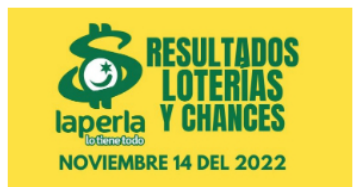
AZAR / 2 meses ago Resultados de loterías y chances el día 14 de Noviembre