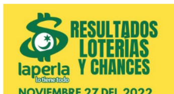
AZAR / 2 meses ago Resultados de loterías y chances el día 27 de Noviembre