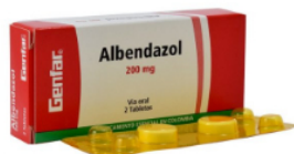
ACTUALIDAD / 8 meses ago Albendazol: para qué sirve, dosis y cómo tomar