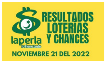
AZAR / 2 meses ago Resultados de loterías y chances el día 21 de Noviembre