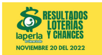
AZAR / 2 meses ago Resultados de loterías y chances el día 20 de Noviembre