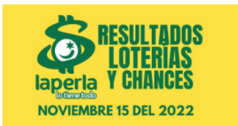
AZAR / 2 meses ago Resultados de loterías y chances el día 15 de Noviembre