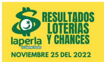
AZAR / 2 meses ago Resultados de loterías y chances el día 25 de Noviembre