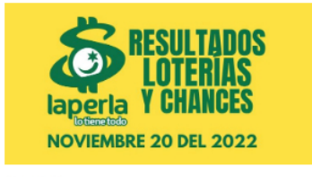
AZAR / 2 meses ago Resultados de loterías y chances el día 20 de Noviembre