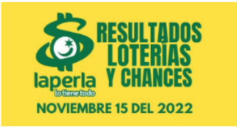
AZAR / 2 meses ago Resultados de loterías y chances el día 15 de Noviembre