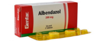
ACTUALIDAD / 8 meses ago Albendazol: para qué sirve, dosis y cómo tomar