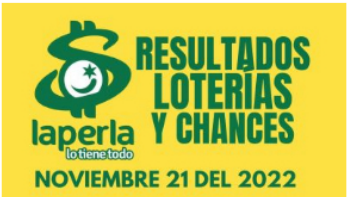
AZAR / 2 meses ago Resultados de loterías y chances el día 21 de Noviembre