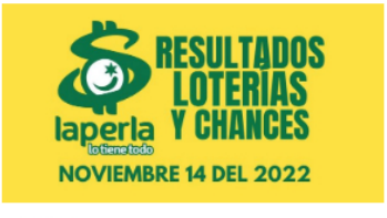
AZAR / 2 meses ago Resultados de loterías y chances el día 14 de Noviembre