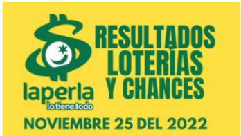
AZAR / 2 meses ago Resultados de loterías y chances el día 25 de Noviembre