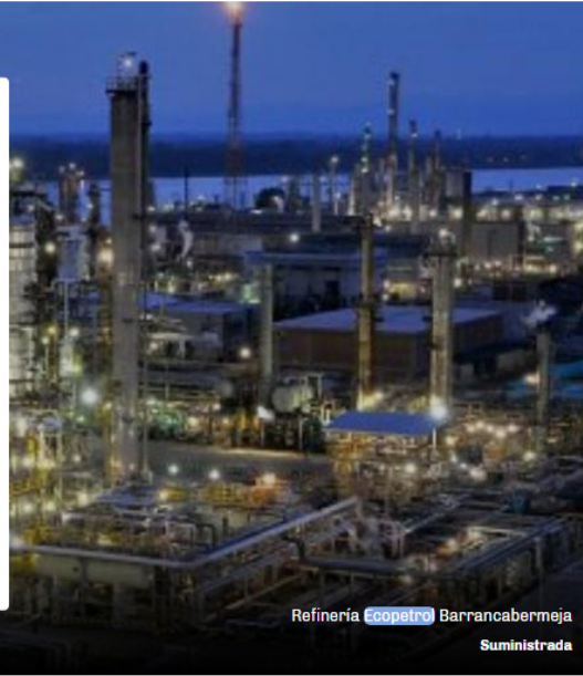
Refinería Ecopetrol Barrancabermeja