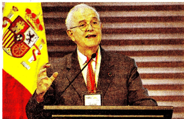
José Antonio Ocampo, ministro de Hacienda.

MIENTRAS el ministerio de Trabajo avanza en la construcción de la reforma pensional del Gobierno de Gustavo Petro, son varias las propuestas que han surgido, como la posibilidad de que Colpensiones se convierta en un banco.