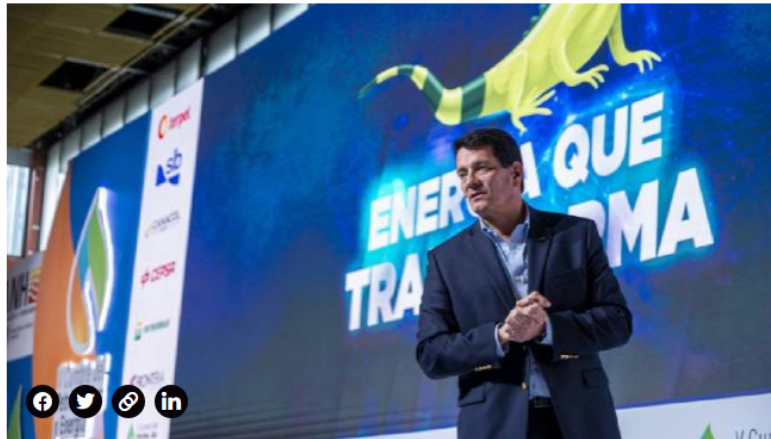
Felipe Bayón, presidente de Ecopetrol .

La entidad señala que el plan de inversiones que tiene estimado Ecopetrol también será muy representativo, puesto que 66% de los US$400 millones serán destinados a las operaciones en Colombia. Esto quiere decir que será una irrigación de $40 billones en inversión local.