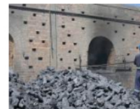
Empresas mineras lideran el mercado exportador en Norte de Santander