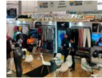
150 empresarios de Norte de Santander en Colombiátex