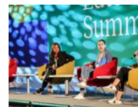
Consejos de mujeres fundadoras para futuras emprendedoras