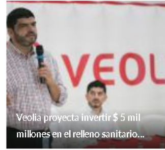
Veolia proyecta invertir $ 5 mil millones en el relleno sanitario...

Tu apoyo para seguir manteniendo el enfoque periodístico que ha caracterizado a La Opinión por más de 60 años es muy importante. Suscribirme.