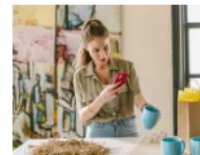
Principales tendencias de los emprendimientos durante 2022