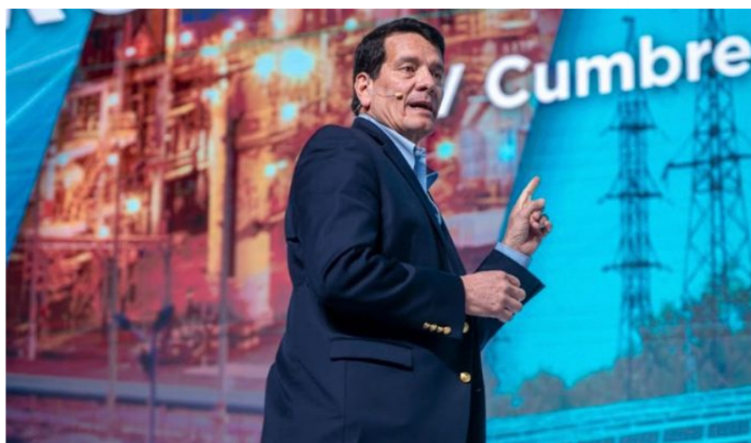
Felipe Bayón, presidente de Ecopetrol

Al inicio del Gobierno de Gustavo Petro, Felipe Bayón, presidente de la empresa más grande de Colombia, Ecopetrol , ha estado bajo la lupa de los colombianos, inversionistas, el Gobierno Nacional y demás actores del sector energético del país.