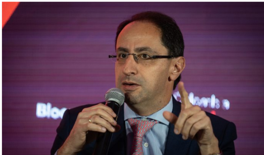
José Manuel Restrepo, exministro de Hacienda, habla sobre anuncios petroleros e indicadores económicos

En entrevista con Valora Analitik, el exministro de Hacienda y ahora rector de la Escuela de Ingenieros de Antioquia (EIA), José Manuel Restrepo, habló acerca de el dólar en Colombia, la inflación y las salidas en falso del Gobierno con los anuncios que ha emitido sobre el sector de hidrocarburos.