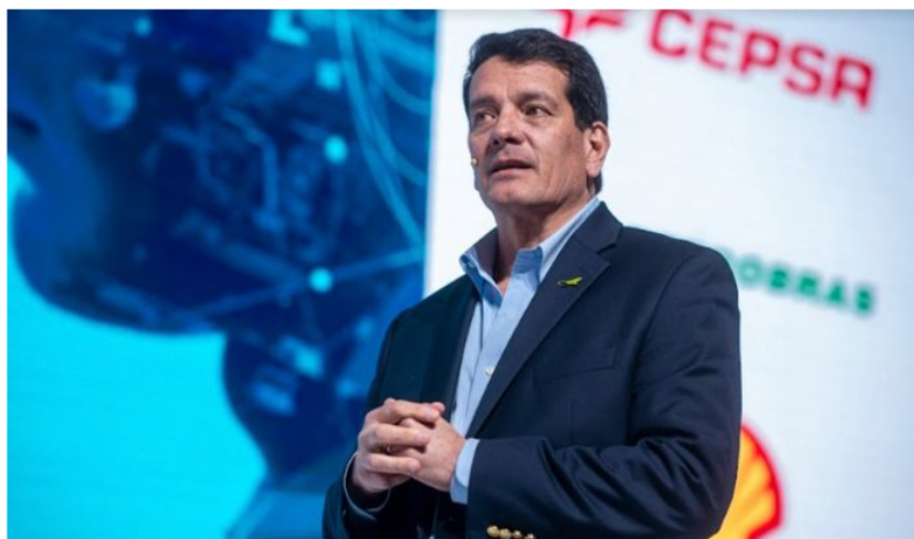
Felipe Bayón, presidente de Ecopetrol

El presidente de Ecopetrol , Felipe Bayón, en su intervención en el Foro Económico Mundial en Davos, aseguró que al interior de la petrolera se cree que sin transmisión de energía no puede haber transición energética.