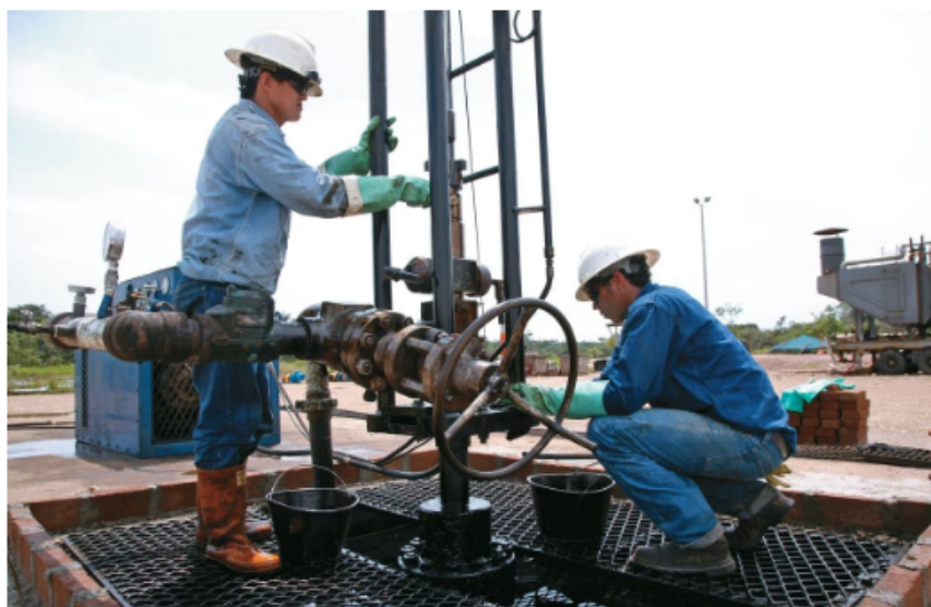
Para varios expertos, el anuncio de la ministra de Minas, Irene Vélez, en el sentido de que Colombia no firmará más contratos de exploración y explotación petrolera, tendrá un duro impacto en la economía del país.

La funcionaria aseguró que el Gobierno continúa trabajando en el objetivo de cumplir con las metas de "descarbonización", en medio de la ruta de transición energética como objetivo primordial. "Estamos viendo la descarbonización de las industrias, pero viendo el modelo productivo y cómo vamos a dejar el carbón atrás", afirmó la ministra durante el panel.