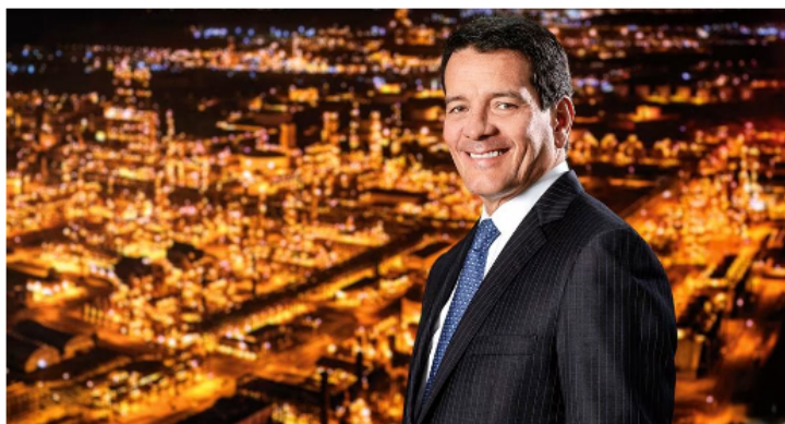
Felipe Bayón, presidente de Ecopetrol, entregó el año pasado resultados históricos para la empresa en ingresos y utilidades.

“En español usamos un término llamado SOSTENIBILIDAD, es poner la tecnología en el centro de ser sostenible. ¿Cómo podremos usar satélites, drones, aviones, equipos portátiles para examinar las emisiones de metano que son difíciles de encontrar y abordar? ¿Cómo usamos nanotecnología en el agua para producir agua de los campos, para que podamos dársela a los campesinos cuando hay verano o sequías?”, explicó.