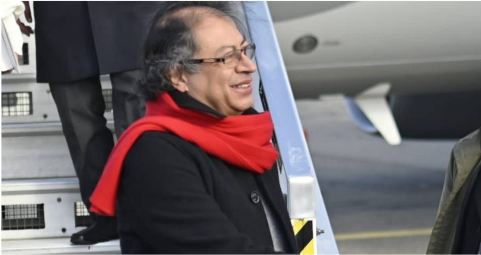
Gustavo Petro a su llegada a Toulouse (Francia).

hidrógeno verde en el corto y no en el largo plazo.