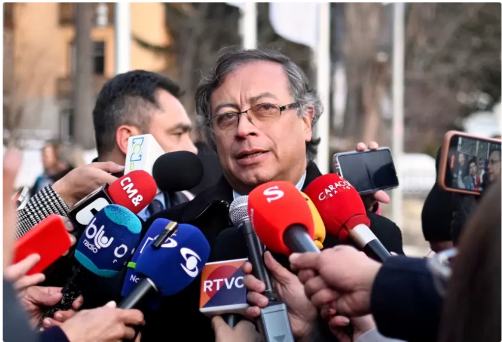
Presidente Gustavo Petro