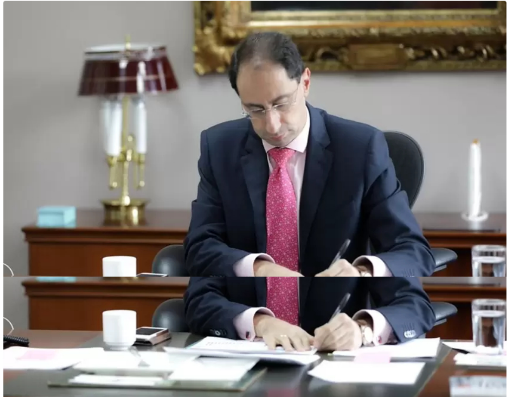
José Manuel Restrepo, exministro de Hacienda