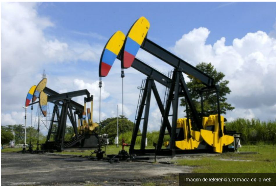
Imagen de referencia, tomada de la web.