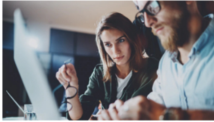
Global Máster en Project Management. Formación 100% en línea con 10 meses de duración