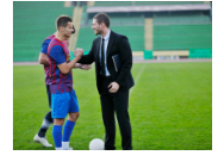
Maestría en 'Sports Management' en línea