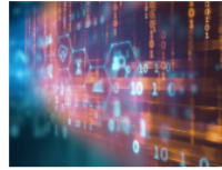
Maestría a Distancia en Ciberseguridad