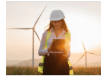
Maestría Universitaria a Distancia en Energías Renovables