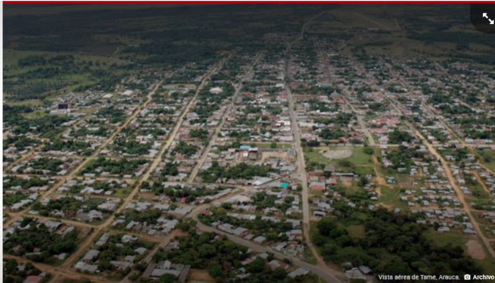
Vista aérea de Tame, Arauca.