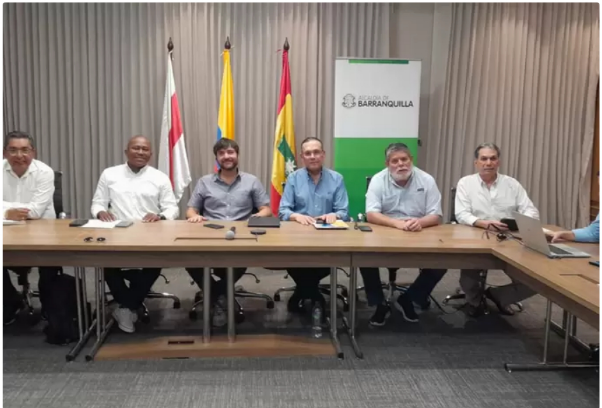
Esperan que las propuestas discutidas, sean acogidas por el Gobierno Nacional