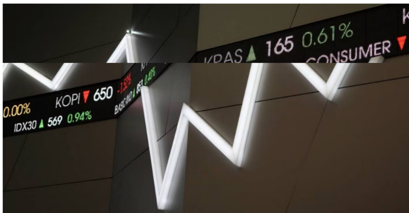
Bolsa de Brasil El mercado brasileño domina el top de las empresas más valiosas de LatAm.

■ Para la mayoría de empresas, los analistas recomiendan mantener las acciones y comprar más. Sin embargo, una minera no tiene los mejores pronósticos, ¿cuál es?