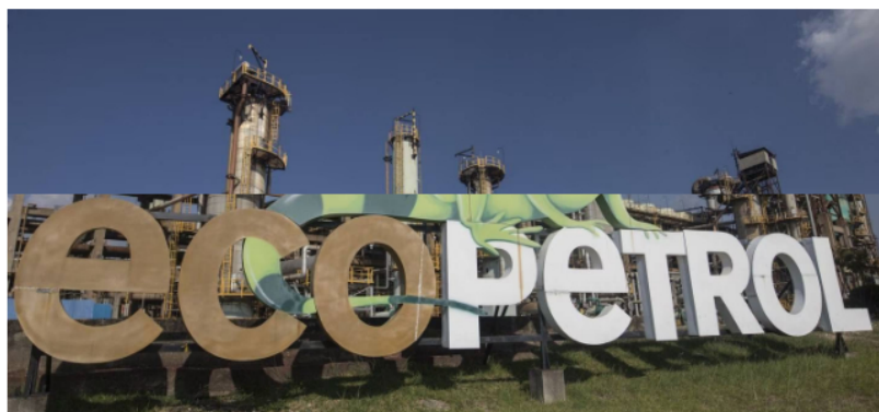
Refinería de Ecopetrol en Barrancabermeja.

■ Bloomberg Línea confirmó que los dirigentes sindicales llegaron a este acuerdo mayoritario que presentarán esta semana a la junta de la Unión Sindical Obrera