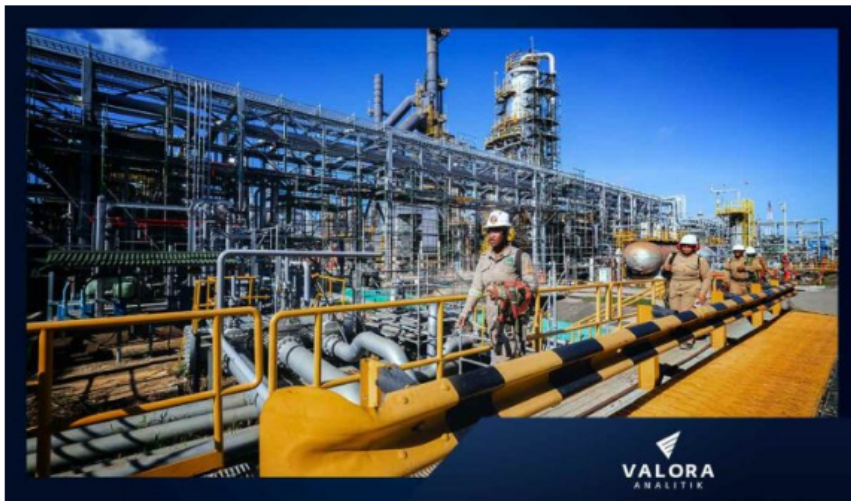
Utilidades de Ecopetrol .

La comisionista Casa de Bolsa en su más reciente Oráculo expuso que las utilidades de Ecopetrol , petrolera estatal colombiana, alcanzarían un nuevo histórico correspondiente al desempeño de 2022.