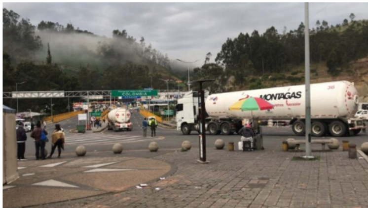
Derrumbe Vía Panamericana, abastecimiento de combustible.

De acuerdo con el análisis económico realizado por la Asociación para el Desarrollo Integral del Transporte Terrestre Intermunicipal (Aditt) y el Consejo Superior del Transporte, la emergencia en la Vía Panamericana ha dejado más de $2.000 millones en pérdidas.